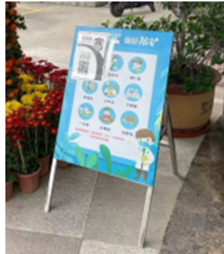
在中亞烯谷深圳辦公室宣傳個人衛生防護的告示牌