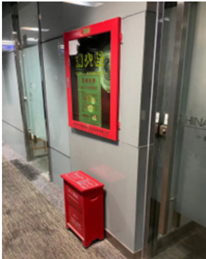
在中亞烯谷深圳辦公室安裝的消防設備

為應對新型冠狀病毒疫情，本集團已採取與個人衛生保護有關的措施，包括但不限於：(i)要求僱員佩戴口罩及勤洗手；(ii)為僱員提供手部消毒劑；(iii)對辦公室進行定期消毒；及(iv)為每位張記僱員提供每月250港元的補貼，用於購買口罩及防疫用品。